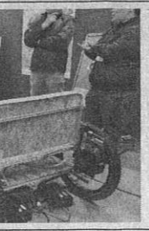
道石狩市）は、高速でジャガイモの芽を取る自動装置の画像認識システムを出展。ニッコ

【札幌】北海道で最大級のビジネスイベント「第33回北海道技術・ビジネス交流会」が7日、札幌市白石区のアクセスサップポロで開幕した。道内企業を中