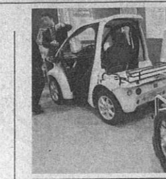
想用齡ル被業構、と切は示丁

純増が期待できる」 大河ドラマも追いは300万人を超えるだろう。大河ドラマやスタジアムをきっかけに亀岡観光のリピーターを増やし、京都の1